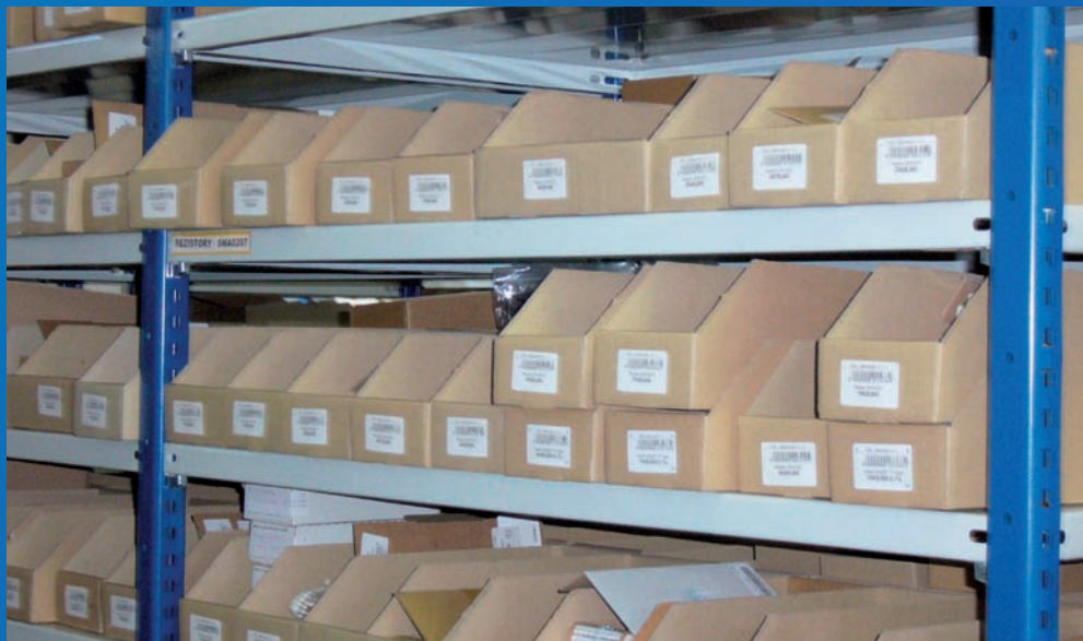
Označení skladových zásob společnosti Elok - Opava, spol. s r.o. čárovými kódy

Společnost Elok – Opava, spol. s r.o. (dále jen Elok – Opava) byla založena roku 1992 a zabývá se vývojem a výrobou elektronických zařízení především pro průmyslové aplikace, stroje a zařízení. Specializuje se zejména na výrobky do prostředí s nebezpečím výbuchu. Hlavní oblastí jsou produkty určené pro petrochemický průmysl (zařízení pro dávkování aditiv, identifikační systémy atd.), komunikační průmysl (GSM komunikace, retranslační karty pro rádiové sítě) a oblast spotřební elektroniky (řídící systémy tepelných zásobníků, napojení na alternativní zdroje energie). V současnosti má společnost celkem 50 zaměstnanců a vlastní výrobní a vývojové kapacity. Dominantní exportní oblastí je Velká Británie, Německo a Holandsko.